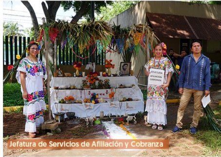
Jefatura de Servicios de Afiliación y Cobranza