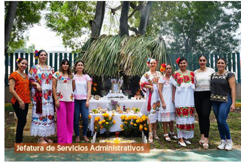
Jefatura de Servicios Administrativos