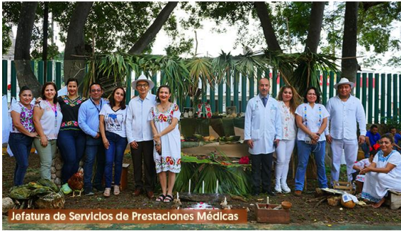
Jefatura de Servicios de Prestaciones Médicas