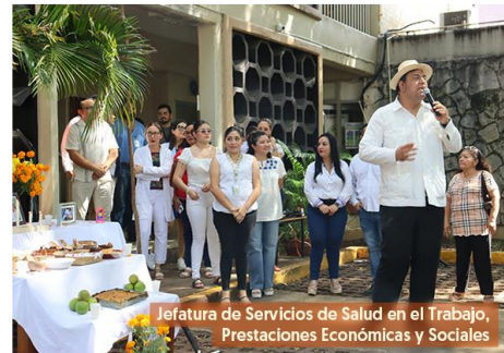
Jefatura de Servicios de Salud en el Trabajo, Prestaciones Económicas y Sociales