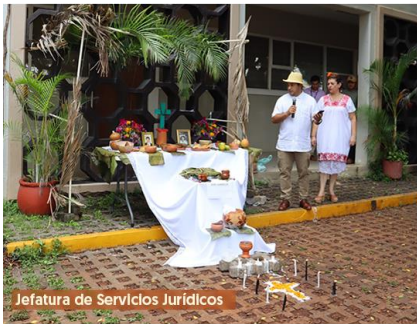
Jefatura de Servicios Jurídicos