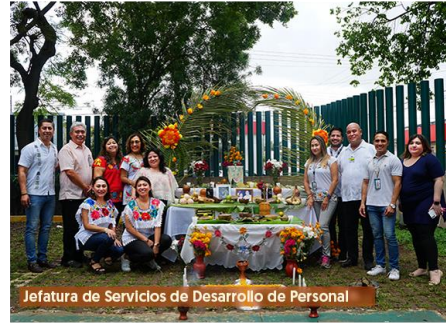
Jefatura de Servicios de Desarrollo de Personal