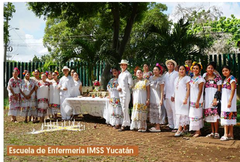
Escuela de Enfermería IMSS Yucatán