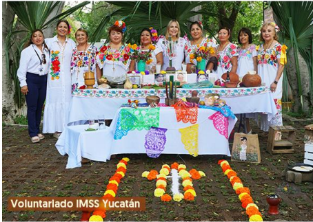
Voluntariado IMSS Yucatán