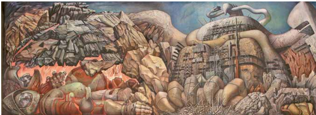
Obra: "México". Autor: Jorge González Camarena.

La portada del libro E-GRAA contiene el mural titulado "México", el cual se encuentra en la planta baja del edificio de las oficinas centrales del Instituto Mexicano del Seguro Social, ubicadas en Paseo de la Reforma No. 476, en la Ciudad de México.